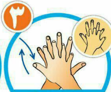
بین انگشتان را در قسمت پشت بشویید.