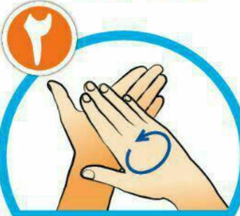
کف دست‌ها را با هم بشویید.