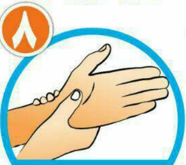
دور مچ هر دو دست را بشویید.