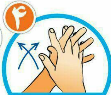
بین انگشتان را از روبرو بشویید.