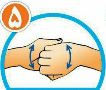
نوک انگشتان را در هم گره کرده و به خوبی بشویید.